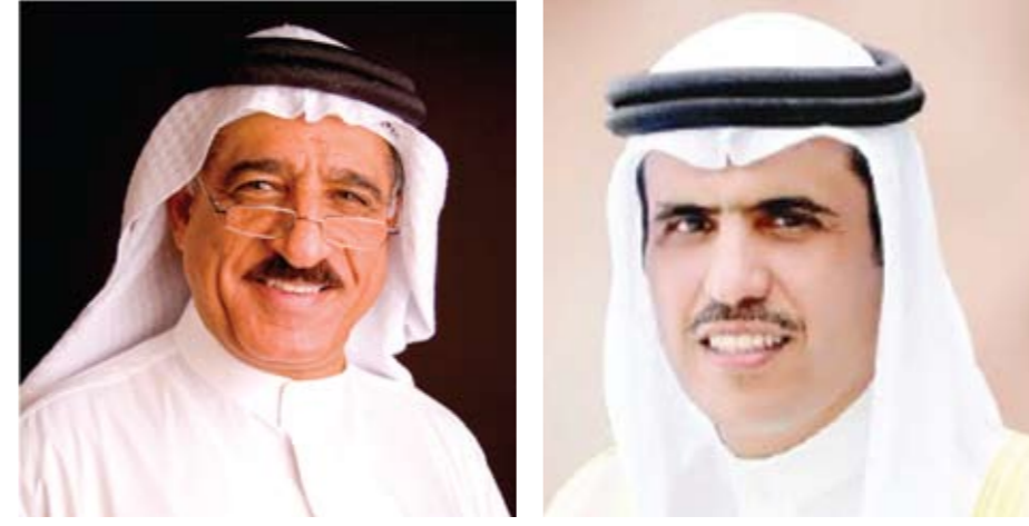
وزير الإعلام: الشباب البحريني المتخرج من جامعاتنا أثبت كفاءته وتميزه