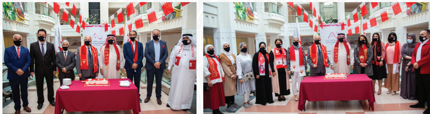
الجامعة الأهلية تحتفل بالعيد الوطني