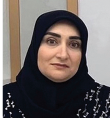
فعالة ومنصفة لكلا الجنسين.

«كوفيد-19»، ويعملون على مدار الساعة ويعرضون أنفسهم وعائلاتهم للخطر من خلال رعايتهم للمرضى المصابين بعدوى الفيروس. وأوضحت أنه على الرغم من تعرض غالبية العاملين في هذا القطاع للفيروس رجالاً ونساءً، فمن المحتمل أن تكون النساء أكثر عرضة لخطر العدوى لأنهن يشكلن غالبية العاملين في مجال الرعاية الصحية.