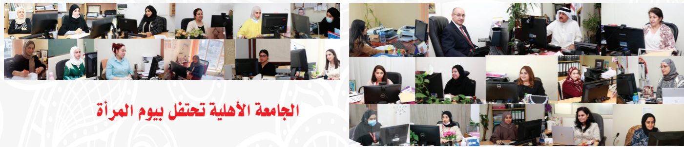
الجامعة الأهلية تحتفل بيوم المرأة