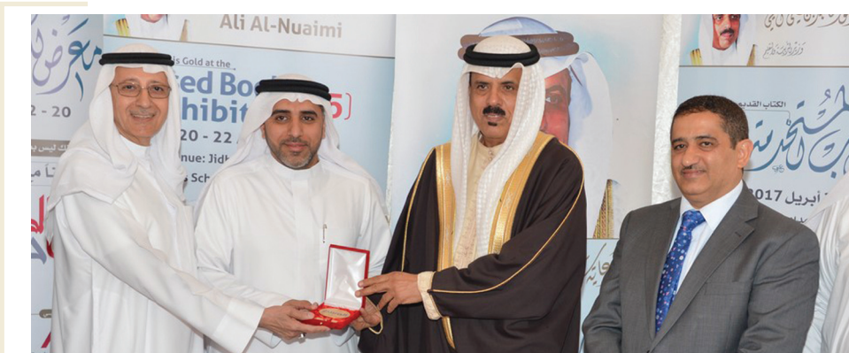
تكريم الجامعة الأهلية (الراعي الذهبي) لمعرض «الوسط» للكتب المستخدمة نسخة العام ٢٠١٧م

وفيما يحتفي العالم يوم (الأحد) الموافق ٢٣ إبريل بمناسبة اليوم العالمي للكتاب، كانت مدرسة جددفص الإعدادية للبنين تحتضن المشهد اللافت. استمرار توافد العشرات من مختلف الأعمار والاتجاهات (والمئات في وقت الذروة)، على المعرض في جميع أيامه، من دون انقطاع، لترصد