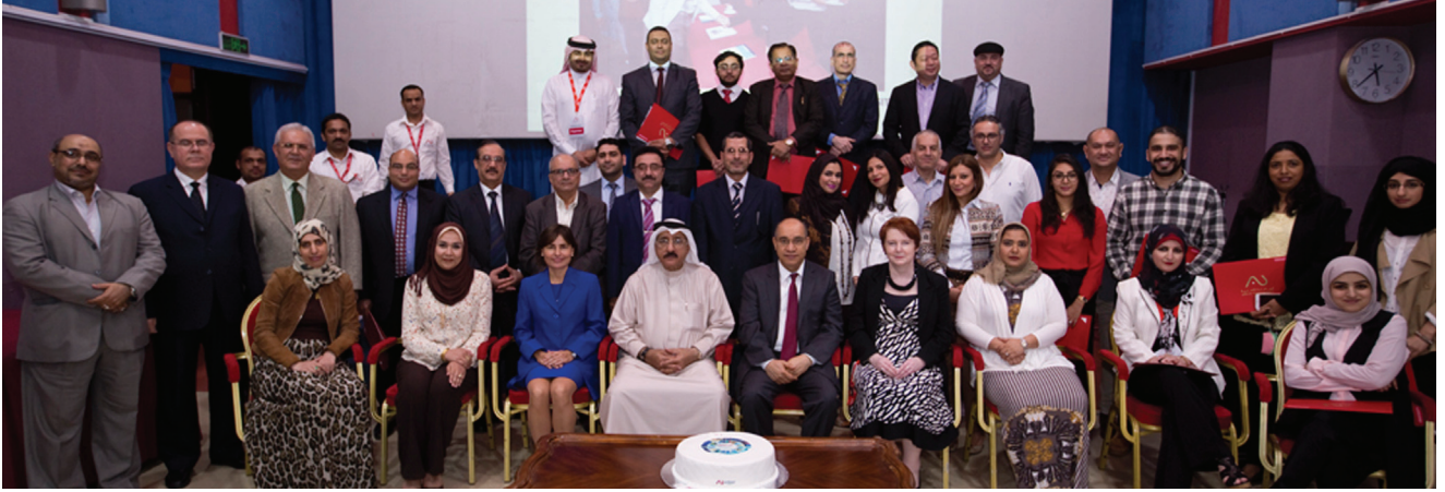
قيادة الجامعة في صورة تذكارية مع عدد من المشاركين في الملتقى

هذه التكنولوجيات مجتمعة إلى تغيير الاتصال والتفاعل إلى الحد الذي يمكن أن يصبح فيه الشخص مدمنا عليها.