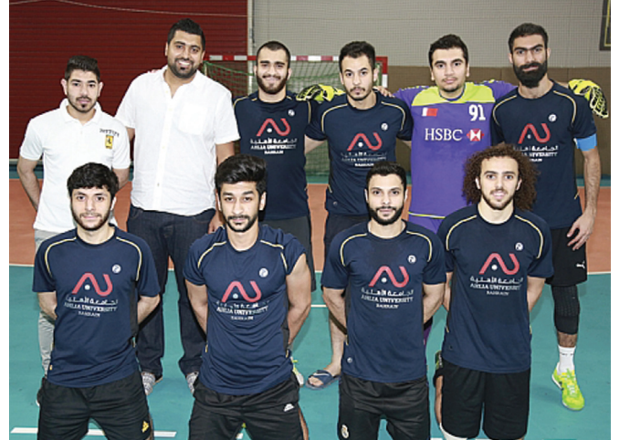
فريق الجامعة الاهلية