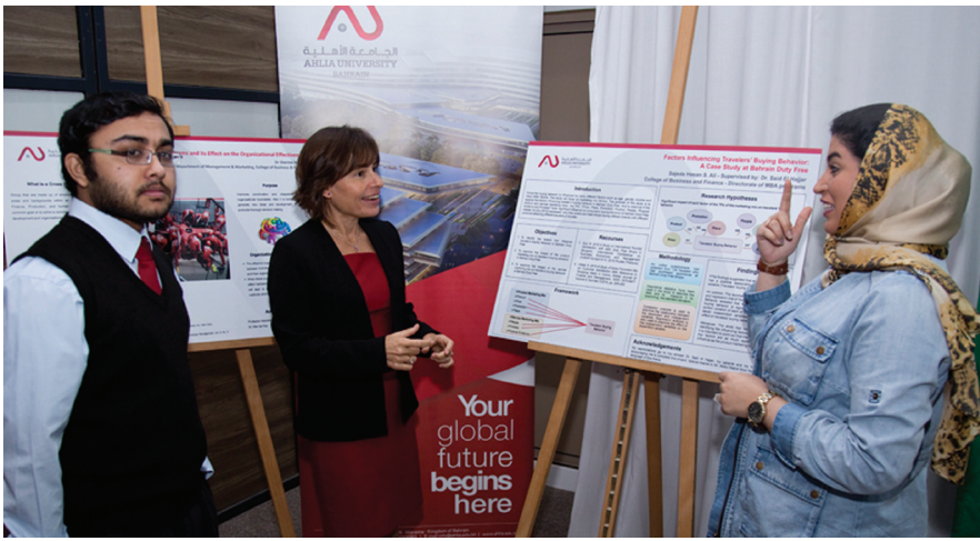
معرض اللوحات العلمية على هامش الملتقى

التكنولوجيا في حل دراسات الحالة الإحصائية، متوصلا في نتائج دراسته إلى أهمية الاستفادة من التكنولوجيا وتوظيفها في البحث العلمي وكذلك في العملية التعليمية، وليس في إحصاءات التعليم والتعلم كأداة فحسب، وإنما أيضا كوسيلة تعلم بحد ذاتها.