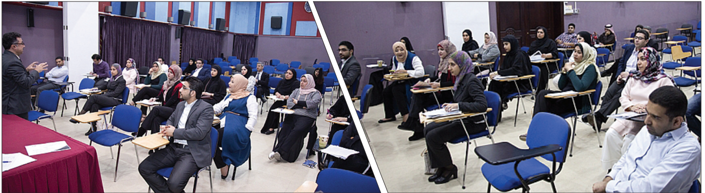
دورة في مجال الاحصاء في البحث العلمي