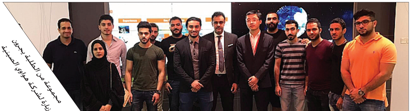
مجموعة من الطلبة يجرون زيارة لشركة هواوي الصينية