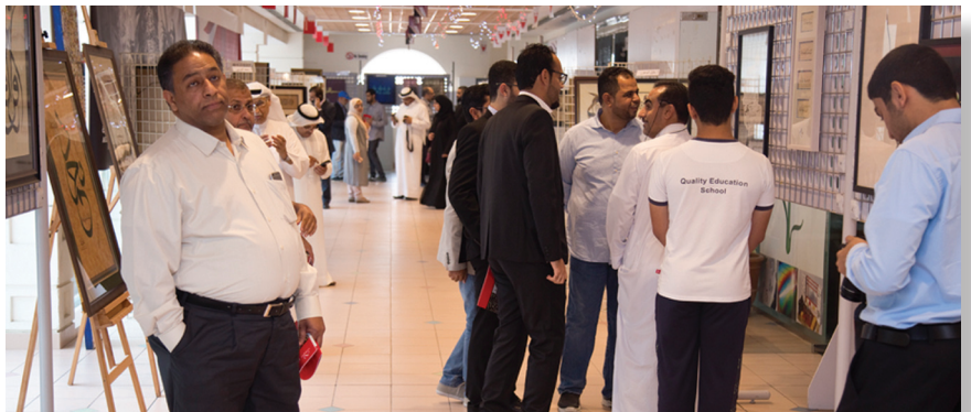
معرض الخط العربي

وفي ختام فعاليات الملتقى الذي تضمن ورشا تدريبيا استوعبت المحترفين والهواة وسائر المهتمين بفن الخط، كرم الرئيس