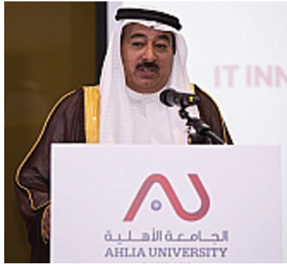
رئيس مجلس إدارة هيئة تنظيم الاتصالات