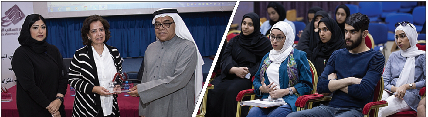
محاضرة تثقيفية للاتحاد النسائي البحريني