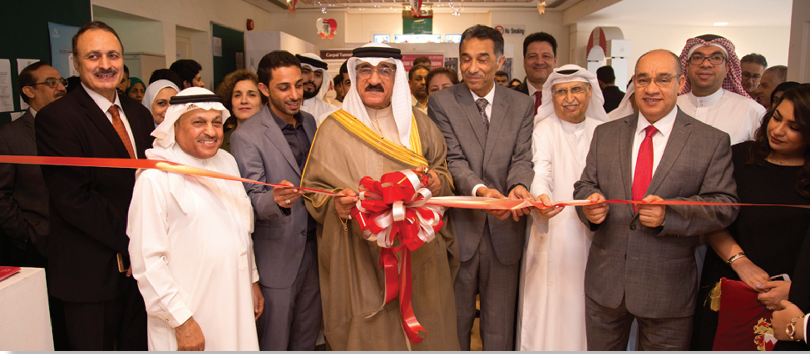
البروفيسور عبدالله الحواج يفتتح فعاليات ملتقى الخط العربي