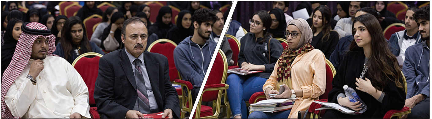
ورش تدريبية لاعداد الطلبة لسوق العمل